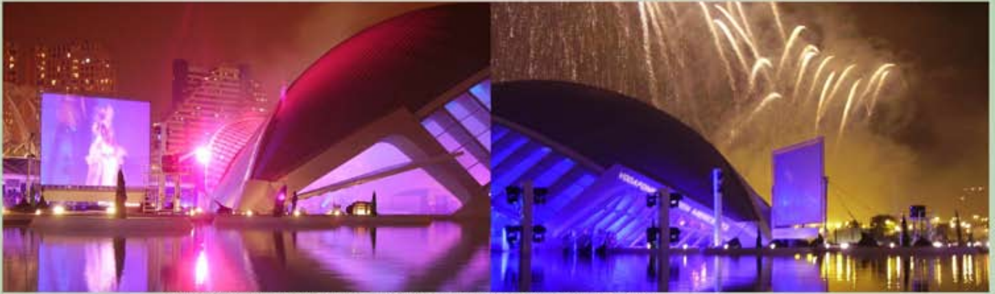
PRESENTACIONES CON PANTALLAS 8X6 Y DUALES R20