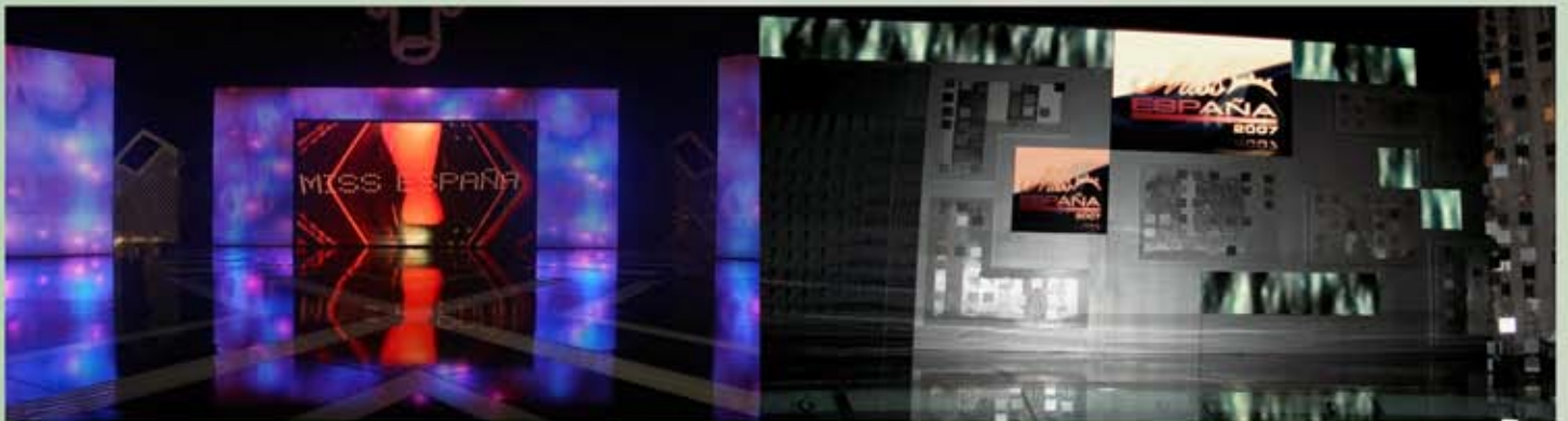
DIVERSAS GALAS CON PANTALLA DE LED I6XP Y LEDWALL MARTIN